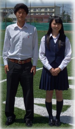
創立以来変わらぬ伝統ある制服！